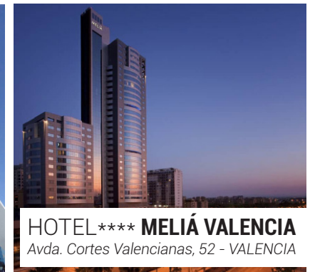
HOTEL **** MELIÁ VALENCIA Avda. Cortes Valencianas, 52 - VALENCIA