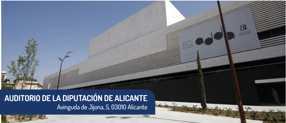
AUDITORIO DE LA DIPUTACIÓN DE ALICANTE Avinguda de Jijona, 5, 03010 Alicante